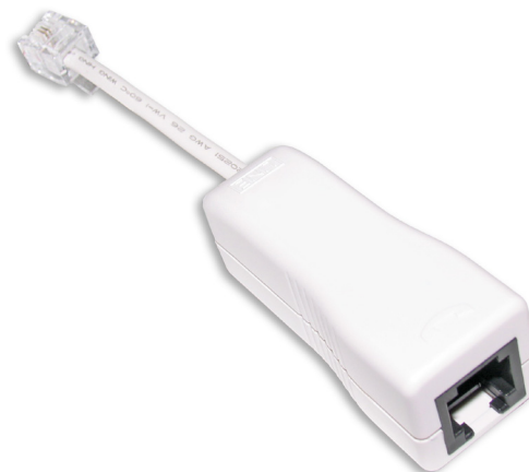
Z-369LS microfiltro residencial ADSL